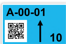
Modèle B : Repérage à QR code