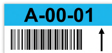
Modèle C : Repérage à texte et code-barres horizontaux