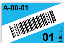
Modèle A : Repérage à code-barres